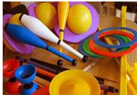
TALLER DE CIRC